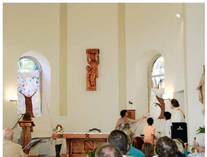
Moment de «révélation» des nouveaux vitraux!