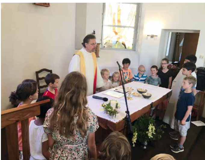
Merci aux enfants de Miex pour leur engagement.